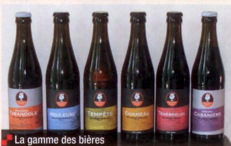
La gamme des bières