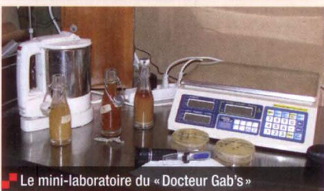
Le mini-laboratoire du « Docteur Gab's »

librés, bien pensés : franchement des bières de grande qualité.